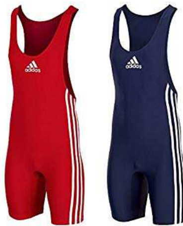
Maillots de lutte