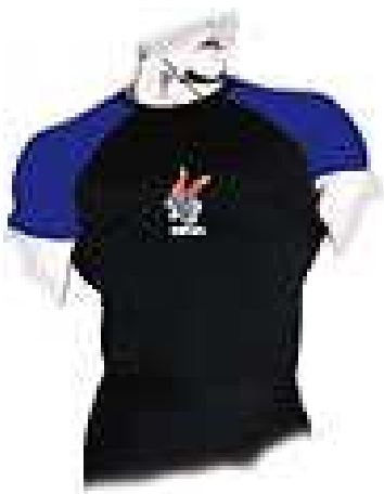
Tenue de maîtrise