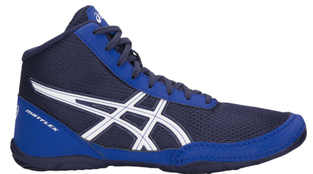
Chaussure de lutte